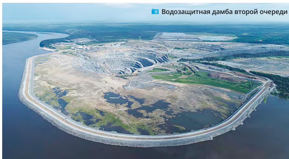
Водозащитная дамба второй очереди

руслу Ангары идут теплоходы с баржами и плотами. В районе Горевского месторождения судовый ход расширен до 150 метров при нормативах в 50 метров. Выполнен отвод ручья Горевского, так как место его впадения в Ангару приходилось на карьер второй очереди. В настоящее время жители старого поселка Новоангарска полностью переселены, поэтому влияния на населенный пункт дамба не окажет. Так что, Новоангарск остается «Горевкой» только для старшего поколения.