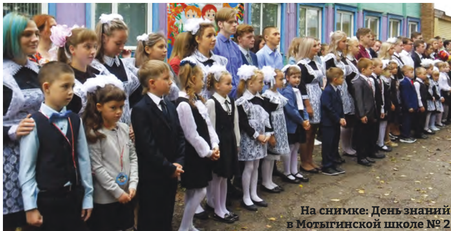
На снимке: День знаний в Мотыгинской школе № 2