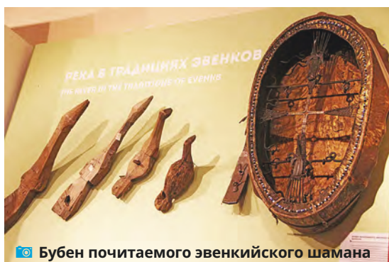
Бубен почитаемого эвенкийского шамана